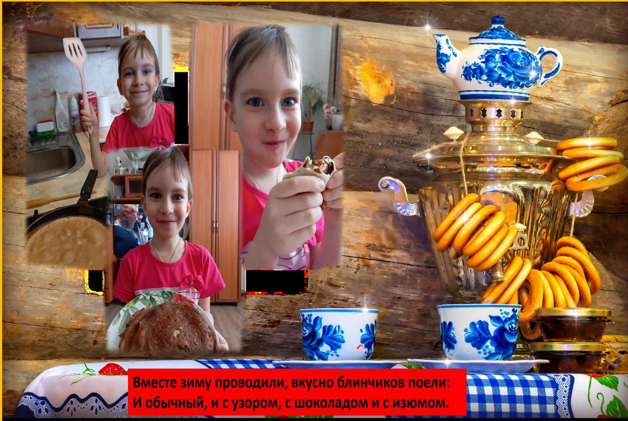
Вместе зиму проводили, вкусно блинчиков поели: И обычный, и с узором, с шоколадом и с изюмом.