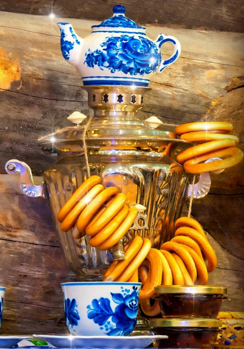
Мы мамуле помогаем, печь блины мы успеваем, Чтобы вместе уплетать и в варенье их макать!