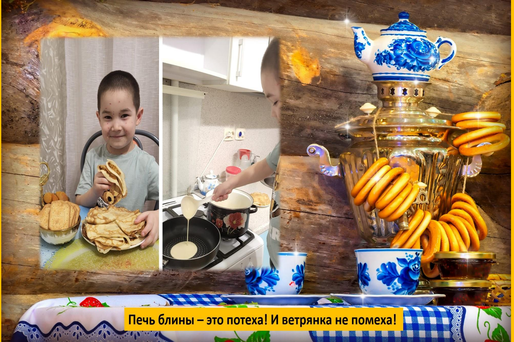
Печь блины – это потеха! И ветрянки не помеха!